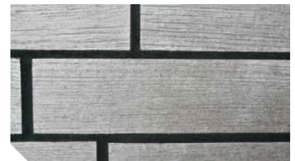
10 Jahre altes Teakdeck

Durch Sonneneinstrahlung und Witterung verändert das Teakdeck seine natürliche Farbe und wird silbergrau. Dieser Effekt ist durchaus erwünscht, manche Bootseigner ziehen es jedoch vor, mithilfe von Pflegemitteln die ursprüngliche Farbe beizubehalten. Hierfür steht das Sika® Teak Pflegesystem bereit, das auf die Verarbeitung auf mit Sikaflex®-290 DC PRO verfüllte Fugen abgestimmt ist.