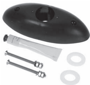
7371 Anbausatz für Echolotswinger (Durchbruchmontage)

Für Ihr neues Nasa Marine Target2 Instrument bieten wir ein umfangreiches Zubehörsortiment an.