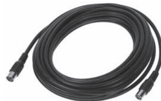
N32 Verlängerungskabel für Echolot-/ Loggeber (6,5m)